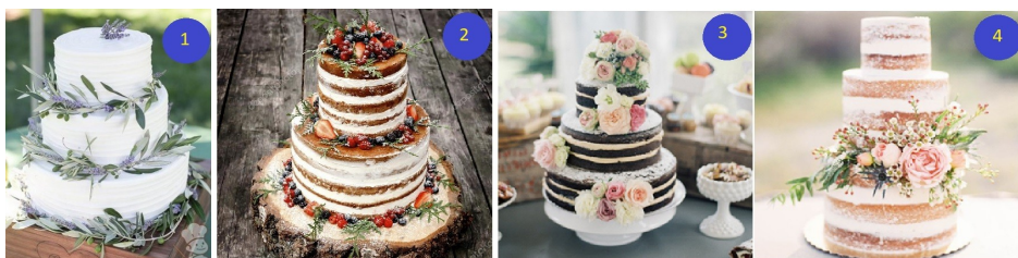
Przyjęcie w stylu rustykalnym