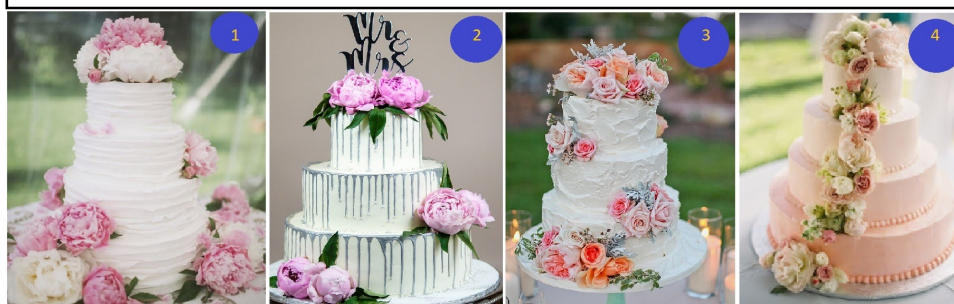
Elegancka uroczystość z morzem kwiatów

W przypadku chrzcin, I Komunii Świętej, jubileuszy i urodzin torty mogą mieć indywidualny charakter i kształt – wzorujemy się na zdjęciach dostarczonych przez Gości drogą mailową.